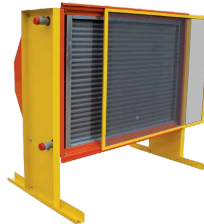
Insektenschutzgitter leicht zu reinigen

Wärmetauscher in stehender Ausführung mit integriertem Insektenschutzgitter.