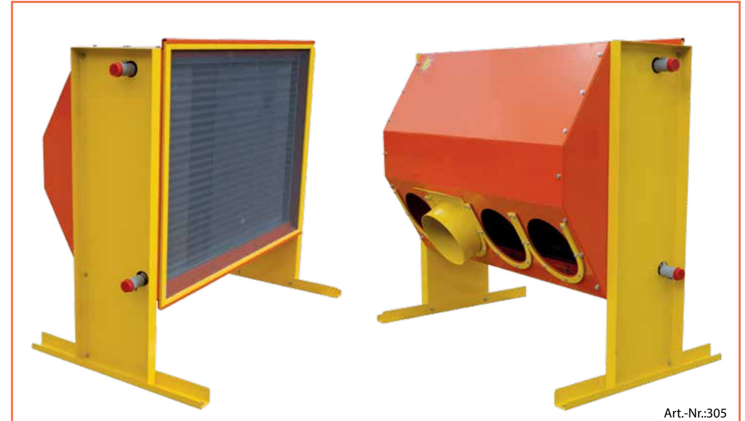
Kompakter Wärmetauscher zur Anwärmung der Ansaugluft